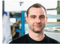
Martin Wittke / TL

M 0175 722 43 83 fertigung@egn-service.de