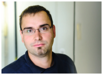
Robert Meinke / BL

M 0174 338 48 77 robert.meinke@egn-service.de